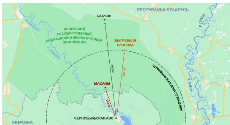
Рисунок 1 – Карта расположения экспериментальных участков (Бабчин, Выгребная Слобода, Масаны) на территории ПГРЗ (Республика Беларусь)

ПГРЗ, позволил выявить некоторые различия в физико-химических свойствах и разницу в уровнях радиоактивного загрязнения почв.